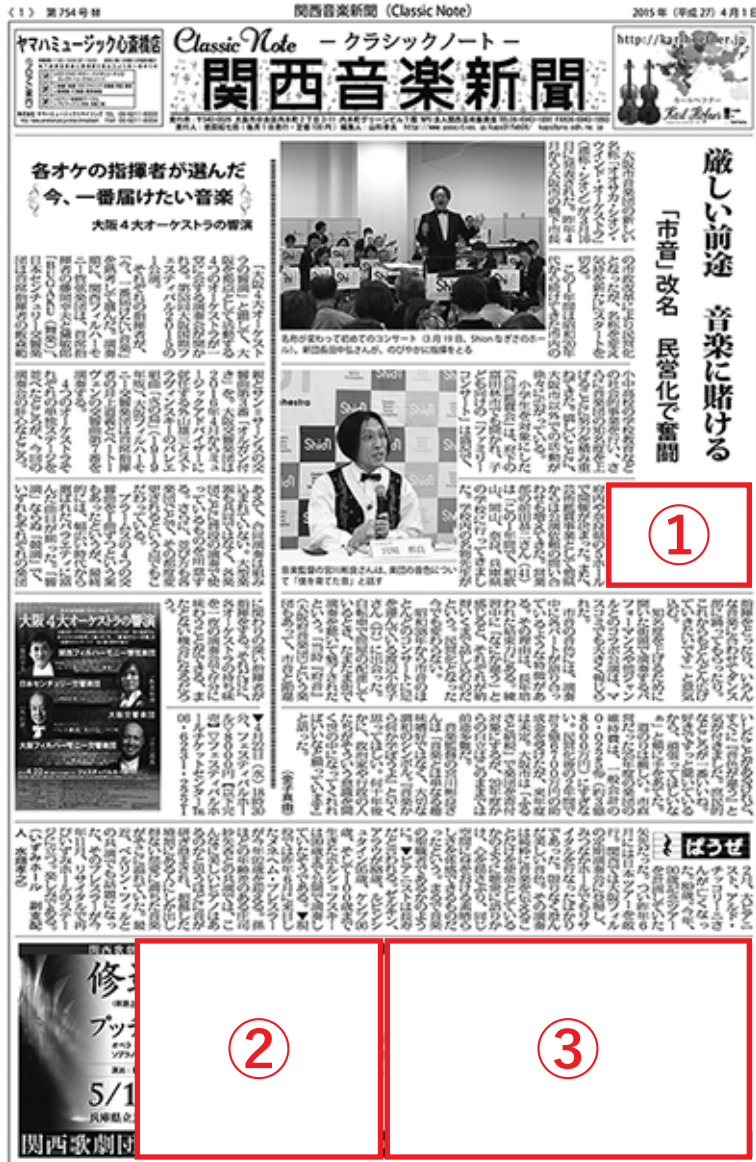
※配置はイメージです

「関西音楽新聞 (Classic Note)」は、1954年4月に創刊されて以来、関西唯一のクラシック音楽およびバレエの月刊専門紙です。毎月1日に、約2万部が発行され、旬のコンサート情報や演奏評など盛り沢山の内容となっています。また、同紙に掲載される広告もコンサートからコンクール情報、教室案内、入試情報など内容は多岐にわたります。基本的には音楽ツウの方に個人購読されている専門紙ですが、大・中規模のホールや図書館にも置かれている裾野の広い新聞なので、関西の音楽文化を伝えるメディアとして高く評価されています。