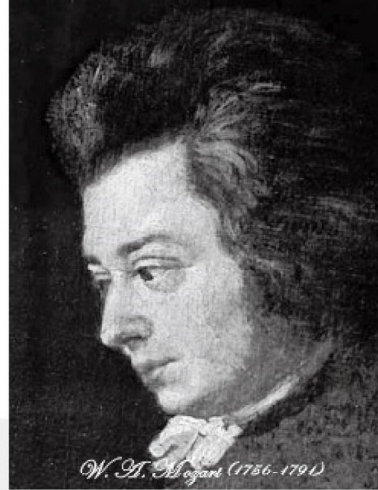
W. A. モーツァルト 作曲

※お客様用の駐車場はございませんので、ご来場の際は電車・バスなど公共交通機関をご利用ください。